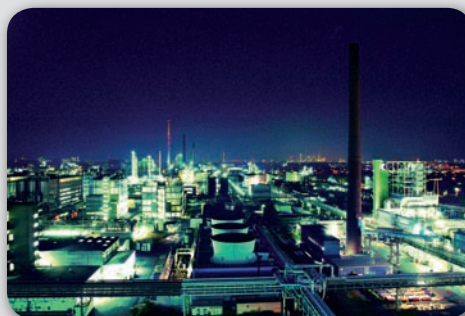
Der Industriepark Höchst bei Nacht