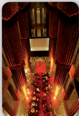
Peter-Behrens-Bau Blick in das Foyer

Zur Abendveranstaltung lädt Infraseriv Höchst Sie zum Dinner im festlichen Foyer des Peter-Behrens-Baus ein. Treffen Sie alte Bekannte von den HÖCHST impulsiv-Abenden, knüpfen Sie neue Kontakte und genießen Sie in der Atmosphäre expressionistischer Architektur einen Abend im Zeichen der Kommunikation.