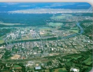
Einblick und Überblick Industriepark Höchst

16.45 Uhr Rückkehr zum Peter-Behrens-Bau